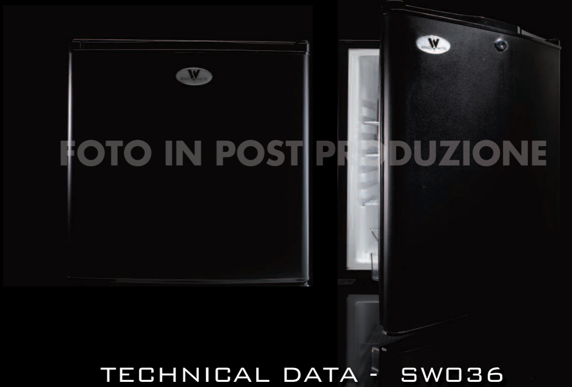
FOTO IN POST PRODUZIONE